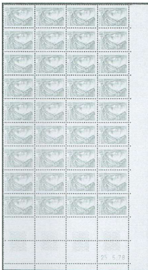
Figure 1 - Première journée du 2 e tirage du 0,80 F brun-vert « Sabine de Gandon » imprimé avec le cylindre A du 25 mai au 12 juin 1978

La première utilisation date du 25 mai 1978 ( Fig. 1 ).