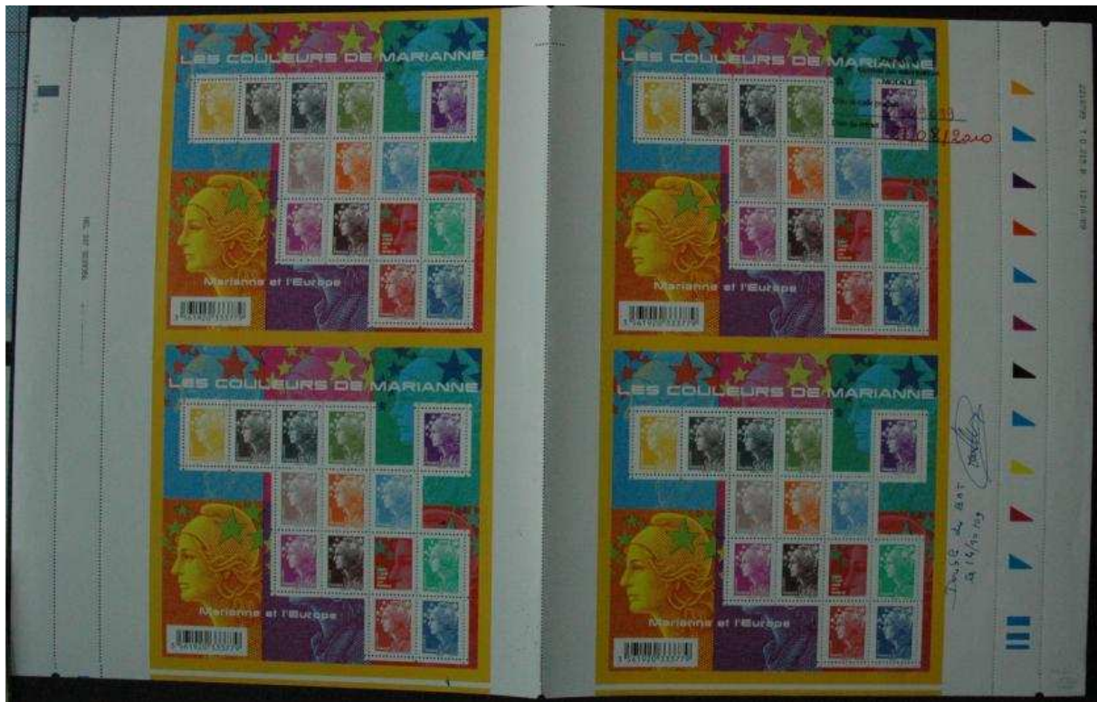
(Bon à Tirer du 14.10.09 de la feuille imprimée après impression de la taille-douce sur la presse TD215)

Nous pouvons observer sur les BâT visualisables aux Archives du Musée de la Poste la date d'impression (12.10.09) ainsi que tous les repères non visibles sur les produits mis à la disposition des clients (numéro de feuille, BOSBT,...). Les indicateurs de service sur les deux presses sont imprimés avec une imprimante jet d'encre.