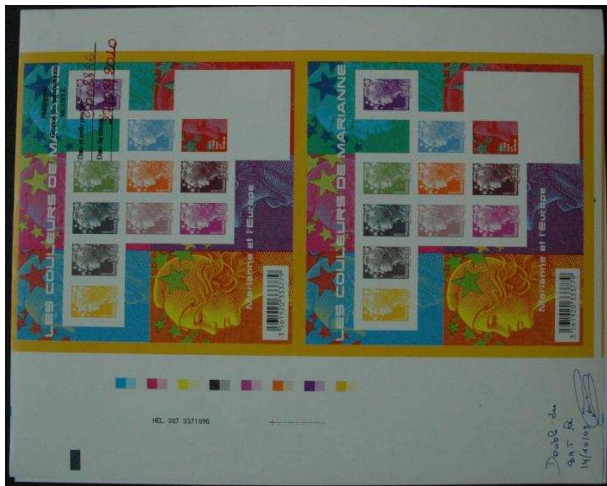
(Bon à Tirer du 14.10.09 de la feuille imprimée en héliogravure sur la presse HEL-307)

La presse HEL-307 est dédiée généralement à l'impression de carnets autocollants avec 4 couleurs au recto et 4 couleurs au verso. Si la fonction de retournement n'est pas activée l'impression de 8 couleurs est possible.