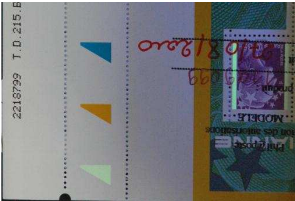
(Repère phosphorescent imprimé en héliogravure sous lampe U.V.)

C'est sur cette presse que sont imprimées les barres phosphorescentes au type H (Hélio) ainsi que le repère noir (Stop and Go) nécessaire pour imprimer sur la presse taille-douce TD215.