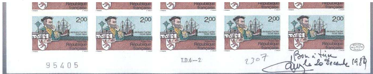
(Bon à tirer du 20.12.84 non dentelé)