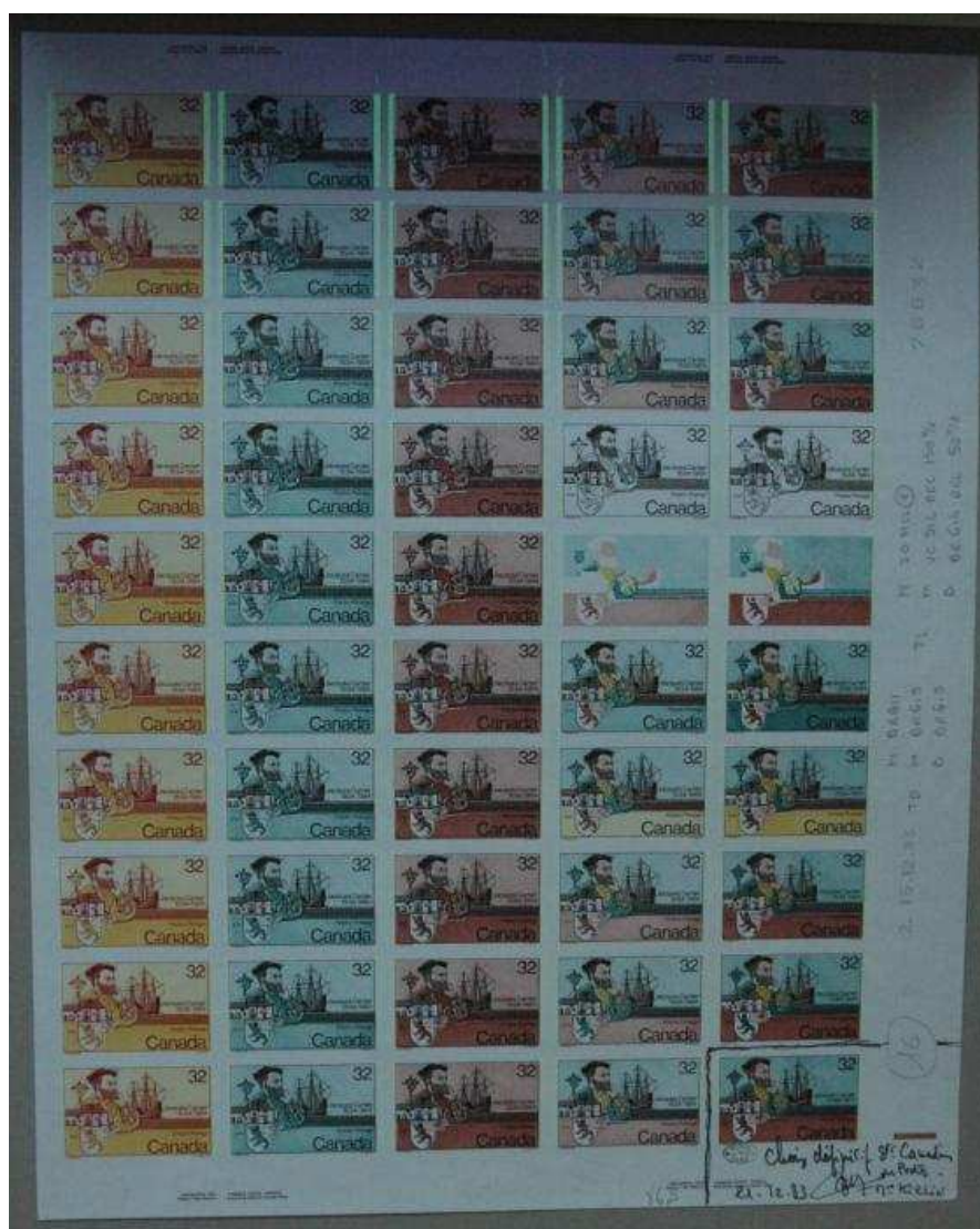
(Feuille n° 76632 du 15.12.83 validée le 21.12.83)

- impression au Canada pour le timbre canadien